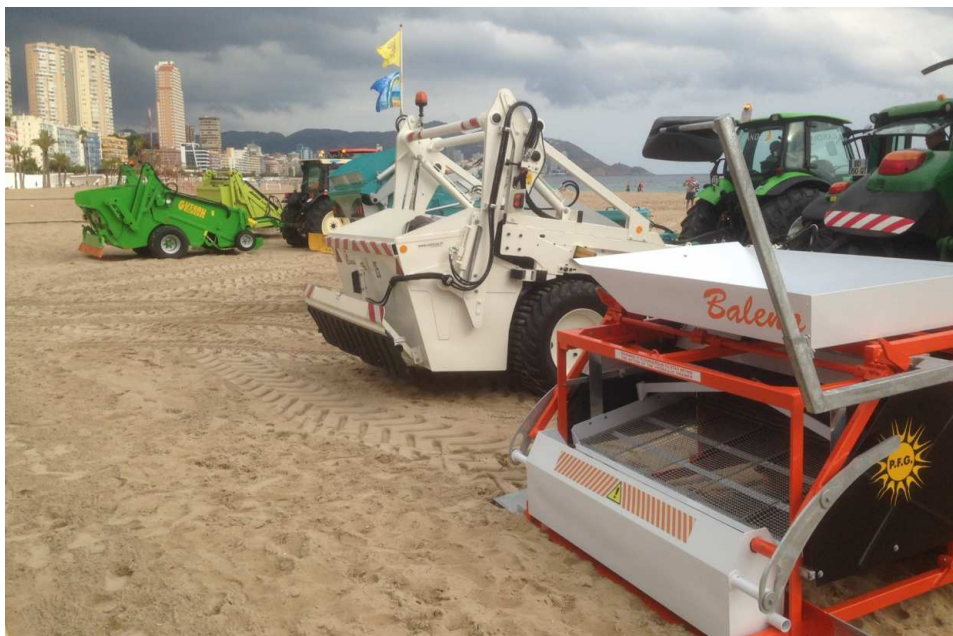
20/10/2016. Demostración de maquinaria en el Hall del Ayuntamiento y en las playas de Benidorm. Actividad organizada conjuntamente con el Congreso Ecoplayas 2016. Exposición de productos para la limpieza y mantenimiento de playas realizada por las principales empresas del sector: maquinaria limpiaplayas, equipamientos y mobiliario urbano, equipamientos de seguridad y salvamento, productos para usuarios con movilidad reducida, sistemas información y concienciación ciudadana, etc.